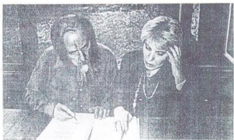
А.И. Солженицын и его жена Н.Д. Солженицына за работой.

Завершает знакомство с жизнью и творчеством А.И. Солженицына четвертая экспозиция. Она посвящена русскому великому писателю, лауреату Нобелевской премии А.И. Солженицыну. Основная мысль Нобелевской лекции, с которой выступает А.И. Солженицын, звучит очень ярко: "Одно слово правды весь мир перетянет". Именно эти слова писателя пронизывают все его произведения.